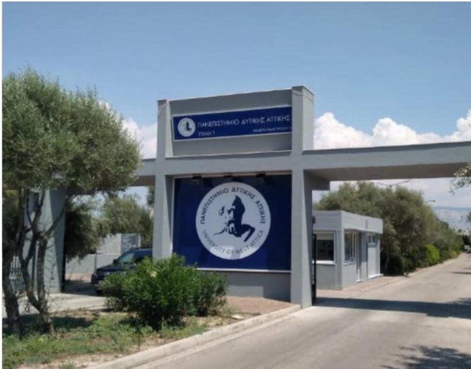
Κεντρική είσοδος Πανεπιστημιούπολης Αρχαίου Ελαιώνα επί της Θηβών 250