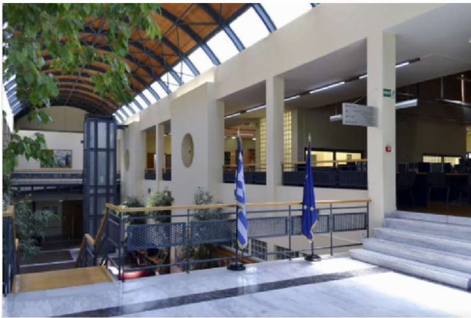
Είσοδος αναγνωστήριου Βιβλιοθήκης Πανεπιστημιούπολης Άλσους Αιγάλεω

Με στόχο την υψηλή γνώση και την ανάπτυξη της φιλοσοφίας, το Πανεπιστήμιο Δυτικής Αττικής λειτουργεί με υψηλές προδιαγραφές (εκπαιδευτικές –ερευνητικές) και ανταποκρίνεται σε μεγάλο βαθμό στις ιδιαίτερα αυξημένες απαιτήσεις μιας σύγχρονης κοινωνίας για δημιουργία στελεχών με σοβαρή επιστημονική και τεχνοκρατική υποδομή.